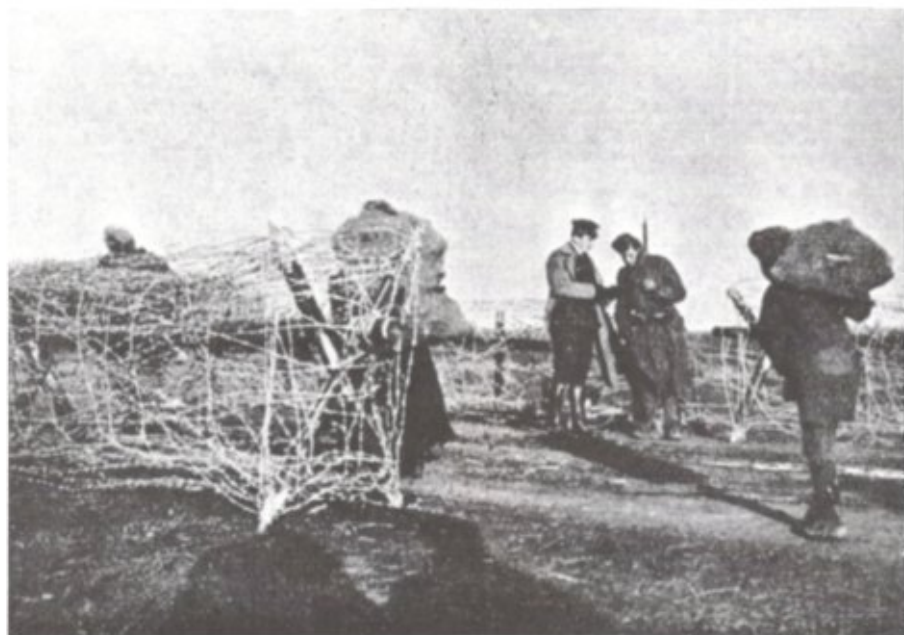
Slovenská hranice v období bojů o Slovensko (1919).